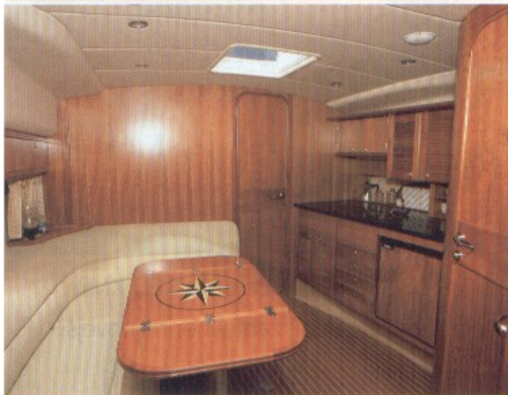
SPODAJ Notranji salon je malo premajhen