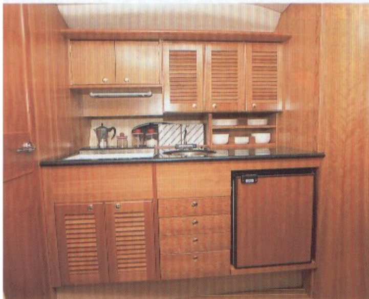
ZGORAJ Lično izdelana kuhinja